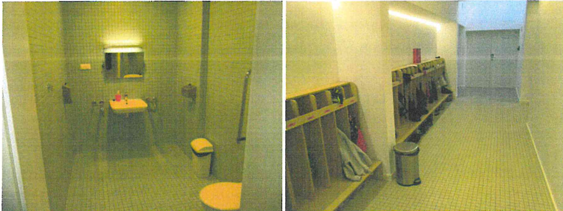
Łazienka przystosowana do potrzeb osób niepełnosprawnych, korytarz, szatnia