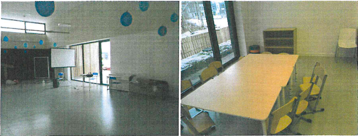
Przykładowe pomieszczenia przedszkola