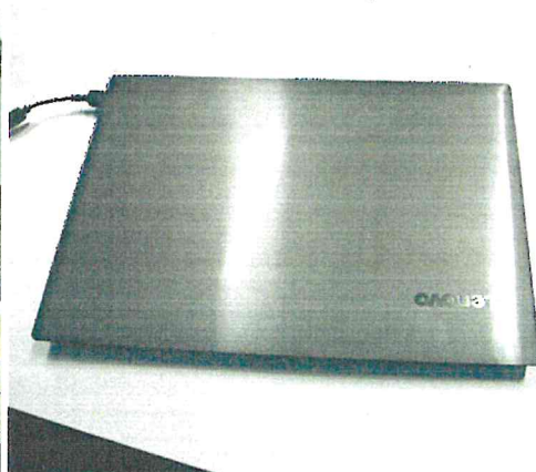
Komputer PC, laptop