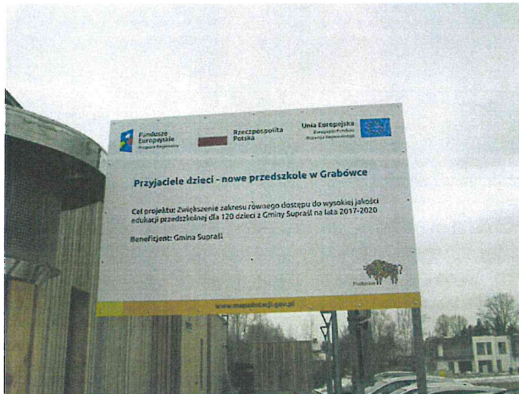
Tablica pamiątkowa w miejscu realizacji projektu (ul. Leszczynowa 14/1, Grabówka)

2. W miejscu realizacji projektu Beneficjent zamieścił tablice pamiątkowe, czego potwierdzeniem jest poniższe zdjęcie wykonane przez zespół kontrolujący.