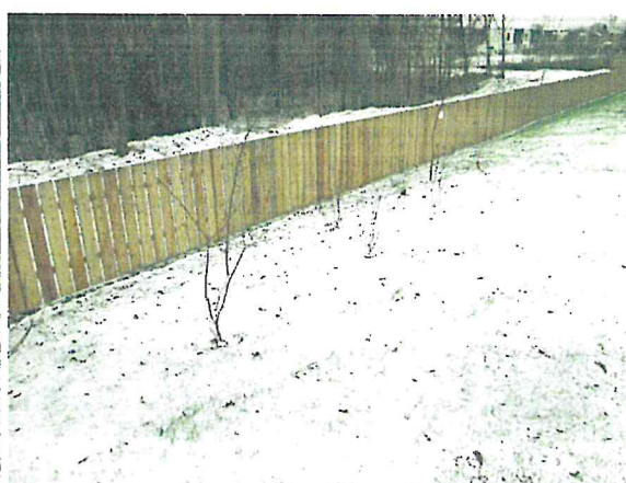
Plac zabaw, ogrodzenie przedszkola