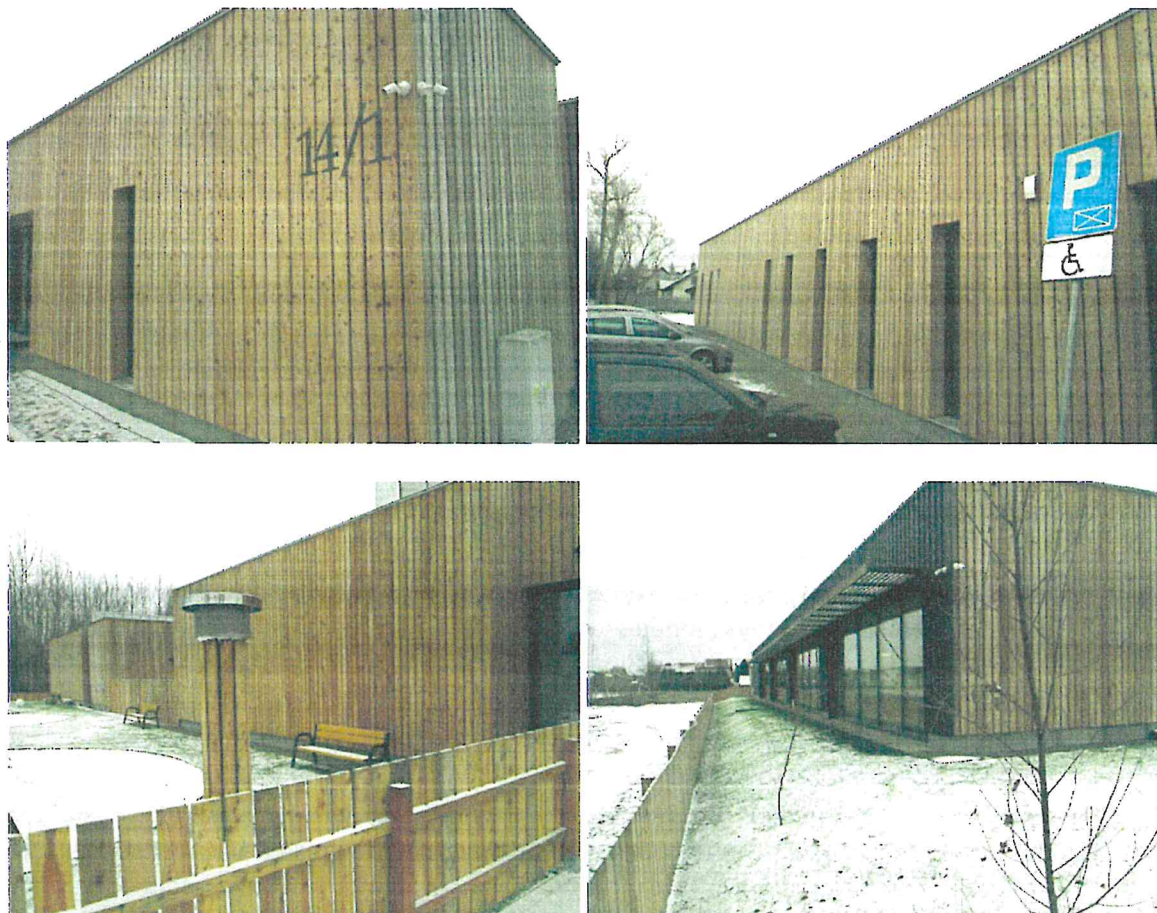
Budynek Przedszkola Samorządowego w Grabówce