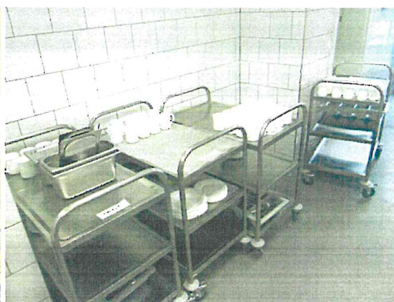
Kuchnia wraz z wyposażeniem