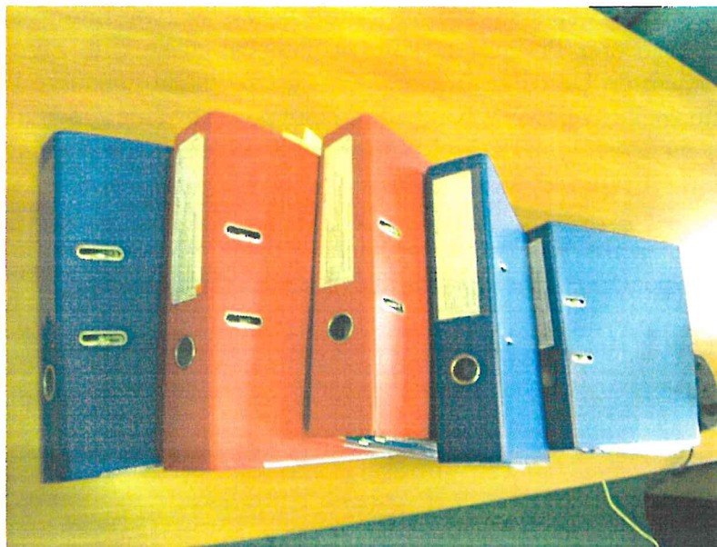
Segregatory, w którym przechowywana jest dokumentacja dotycząca projektu

2. W trakcie kontroli stwierdzono, że dokumentacja jest przechowywana w odrębnych, oznaczonych właściwymi logotypami segregatorach pod adresem: ul. Piłsudskiego 58, 16-030 Supraśl. Beneficjent przedstawił oświadczenie o sposobie przechowywania i archiwizacji dokumentacji projektu stanowiące załącznik nr 13 do Informacji Pokontrolnej. Wszystkie wymagane w trakcie kontroli dokumenty były dostępne.