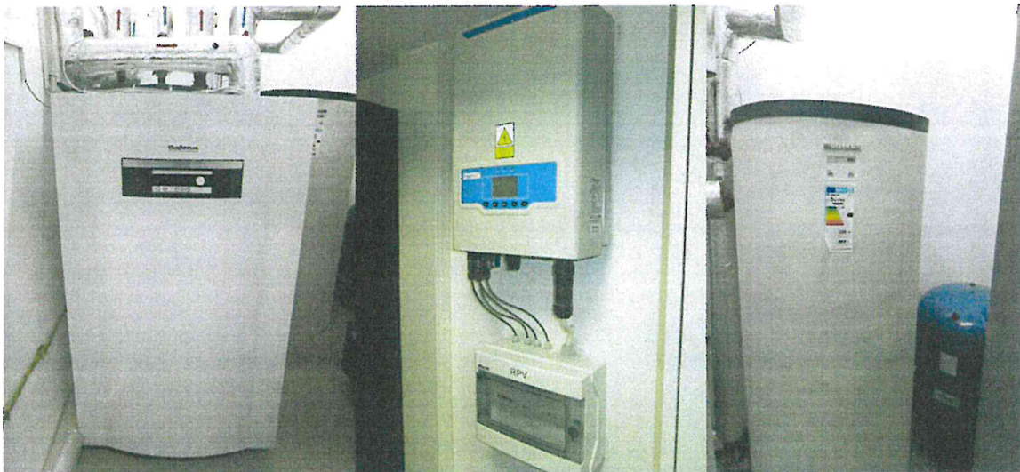
Pompa ciepła, elementy instalacji fotowoltaicznej, zbiornik buforowy