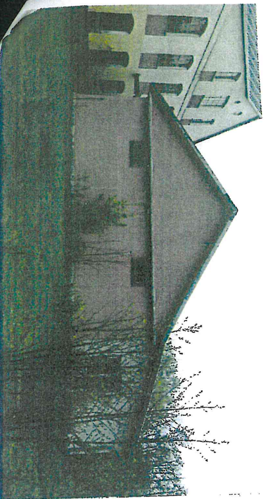
Widok na elewację południową