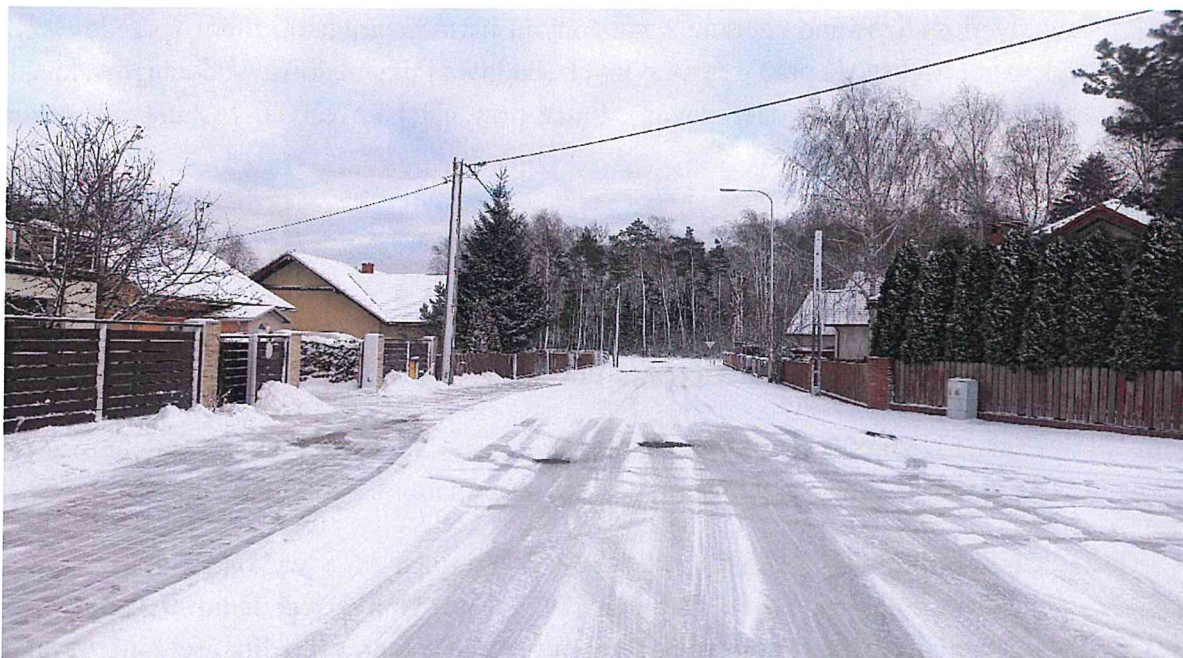
ul. Cyprysowa w Grabówce