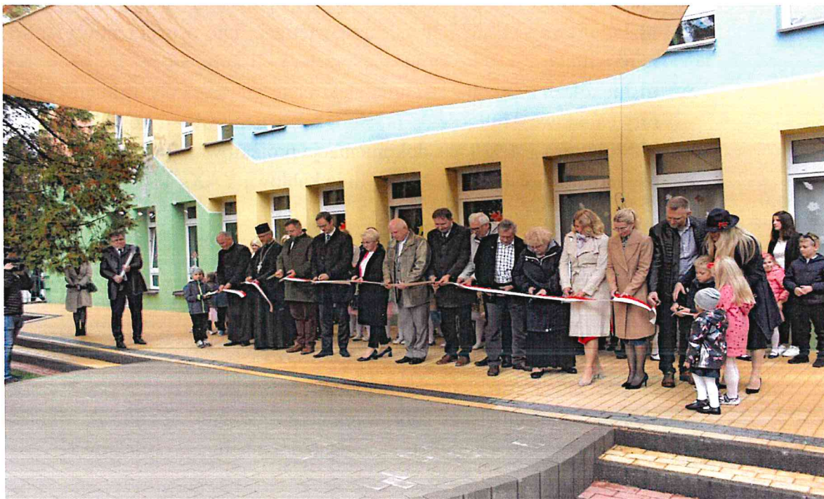
Uroczyste otwarcie placu zabaw

Przedszkole modułowe w Karakulach – 1.845 zł wydatkowano na zakup mapy do celów projektowych.