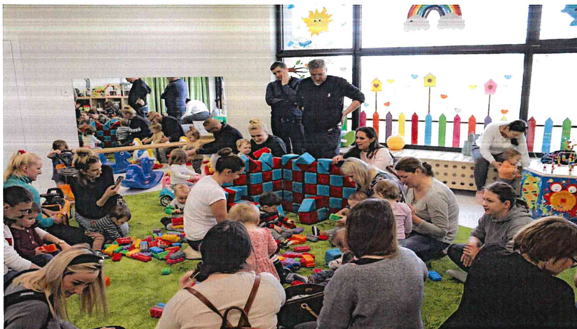
Dni otwarte w przedszkolu w Sobolewie

drogowym: droga dostaw do kuchni, odbiór odpadków - związanych z wybudowaniem nowego skrzydła budynku, a także wykonanie wewnętrznego układu ciągów pieszych – chodników, z dowiązaniem się do istniejącego układu komunikacji pieszej na działce, schodów terenowych, tarasów i opasek przy budynku, korekta i zmiana zakresu zasięgu terenów rekreacyjnych, przeniesienie urządzeń placu zabaw w inne miejsce, terenów rekreacyjnych i zajęciowych na świeżym powietrzu, urządzenie terenów zielonych wraz z nasadzeniami drzew i krzewów. Przewidziano budowę niezbędnego do prawidłowego funkcjonowania całego obiektu przyłącza gazowego oraz budowę niezbędnych do prawidłowego funkcjonowania rozbudowywanej części instalacji doziemnej: wodociągowej, kanalizacyjnej sanitarnej, oświetlenia terenu. Pomieszczenia mają być dostosowane do obowiązujących przepisów techniczno-budowlanych w tym przepisów dot. warunków ppoż. oraz być dostępne i dostosowane dla osób niepełnosprawnych. W 2021 r. wykonawca sporządził pełnobrańzową dokumentację projektową oraz uzyskał pozwolenie na budowę. W 2022 roku rozpoczęto prace budowlane w zakresie przebudowy kolidującej infrastruktury podziemnej, przyłączy wodno-kanalizacyjnych oraz prace przy stanie surowym nowej części szkoły. Zrealizowane zostały fundamenty, podpiwniczenie budynku oraz konstrukcja pierwszej kondygnacji nadziemnej. Wartość robót budowlanych 6.785.145,37 zł . Prace zostaną zakończone do końca 2023 r.