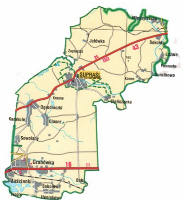
Rycina nr 2. Obszar gminy Supraśl.

Supraśl, co ma istotne znaczenie dla rozwoju turystyki oraz uzdrowiska, otaczają przepiękne lasy Puszczy Knyszyńskiej. Samo miasteczko przecina Dolina Supraśli, z leniwie płynącą, czystą rzeką, nazywaną niegdyś także Sprząślą, której źródła wypływają na wysokości 151 m n.p.m. wśród bagien Wysoczyzny Białostockiej, kończąc bieg w rzece Narwi.