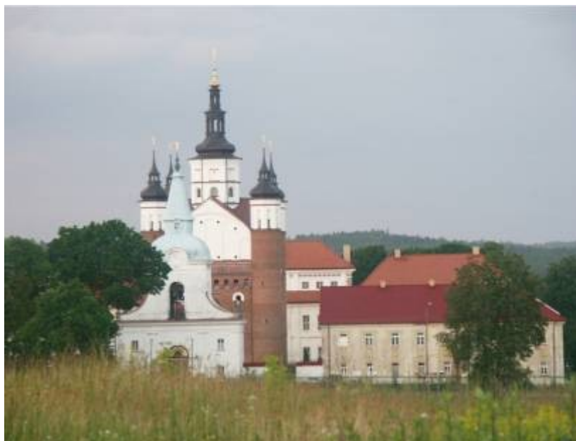
Rycina nr 5. Widok na Monaster, dawny Klasztor Bazylianów w Supraślu

umacnianie jego gospodarczej pozycji. Bazylianie handlowali nawet z takimi znanymi ośrodkami ówczesnej Europy jak Gdańsk czy Wilno. Wszechstronność gospodarcza mnichów pozwalała im na czerpanie dochodów nie tylko z posiadanych manufaktur, ale także gospodarki leśnej. Nie tylko jednak działalność gospodarcza wyróżniła działalność Zakonu i samo miasto Supraśl. Klasztor przez lata stanowił istotny ośrodek rozwoju kultury, w tym ze szczególnie znaną, bogatą w zbiory biblioteką oraz nie mniej słynną drukarnią (1696-1803), wyposażoną od 1710 r. we własną papiernię.