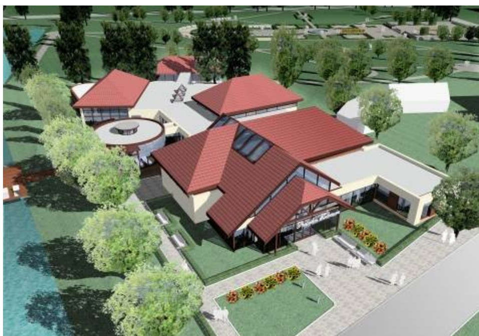
Rycina nr 4. Wizja rozwoju zakładu przyrodoleczniczego, w tle widok na planowane do rekonstrukcji Ogrody Saskie (źródło: Studium Wykonalności Uzdrowiska Supraśl UM Supraśl, projekt oraz wizualizacja Piotr Konopka oraz Barbara Janczuk na zlecenie PART S.A.)

Położenie Supraśla w sercu lasów Puszczy Knyszyńskiej, terenu należącego do Zielonych Płuc Polski, predestynuje miasto do świadczenia usług uzdrowiskowych oraz rozwoju turystyki zdrowotnej. Do pełnienia funkcji uzdrowiska premiuje także bliskość Białegostoku - ważnego w Polsce centrum medycznego, z silną bazą naukową i kliniczno-szpitalną.