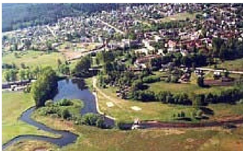
Rycina nr 3. Panorama Supraśla oraz doliny i rzeki Supraśli z „lotu ptaka”

Supraśl, co ma istotne znaczenie dla rozwoju turystyki oraz uzdrowiska, otaczają przepiękne lasy Puszczy Knyszyńskiej. Samo miasteczko przecina Dolina Supraśli, z leniwie płynącą, czystą rzeką, nazywaną niegdyś także Sprząślą, której źródła wypływają na wysokości 151 m n.p.m. wśród bagien Wysoczyzny Białostockiej, kończąc bieg w rzece Narwi.