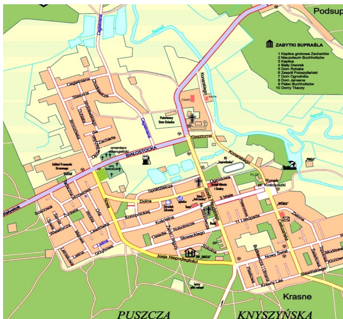
Rycina nr 6. Plan Supraśla

Kolejny okres znacznego rozwoju terytorialnego to lata sześćdziesiąte i siedemdziesiąte XX w., kiedy to m.in. na dawnych polach zachertowskich między ul. Piłsudskiego a ul. Żwirki i Wigury powstały zabudowania ul. Słowackiego. Domami mieszkalnymi zapełniły się też tereny nad dawnymi stawami klasztorными wzdłuż strumyka Grabówka. Ostatnim zwartym terenem do zabudowy mieszkalnej jest północno-zachodnia część Supraśla, rozciągająca się od ul. Cegielnianej do granicy lasu, gdzie w ostatnich latach powstaje nowe osiedle mieszkaniowe. Dalsza ekspansja terytorialna miasteczka nie jest możliwa – skutecznie ją hamuje rozciągająca się wokół Puszcza Knyszyńska.